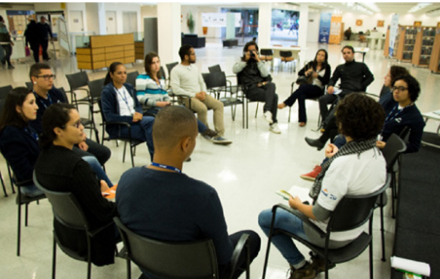
Foto 4 - Atividade Roda de Leitura