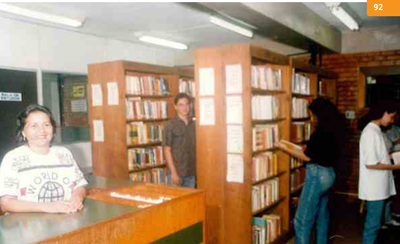
Foto 4 - Setor de Atendimento da Biblioteca da Unidade Centro

“Sendo assim, recebemos usuários com diversos graus de conhecimento, que vão desde os que estão iniciando a utilizar as novas