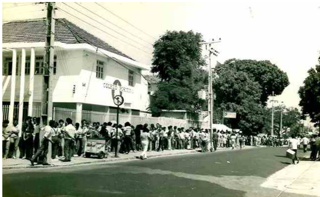
Foto 1- Inscrição para curso. Fila iniciando na Av. Tristão Gonçalves, estendendo-se a outras três ruas