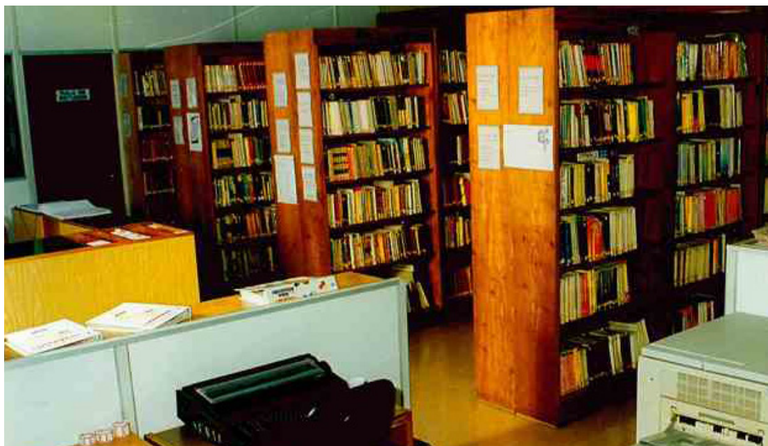
Foto 6 - Área de Atendimento da Biblioteca Unidade Centro

Outra ação de incentivo à leitura é a estante expositora, que divulga as novas aquisições e sugestões de leitura. “Buscamos com essas ações integrar os alunos ao ambiente da Biblioteca para que se sintam à vontade para usufruir de nossa infraestrutura e desenvolver ainda mais suas capacidades informacionais”, reforça a coordenadora.