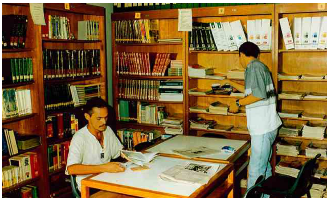
Foto 5 - Aluno no birô de leitura